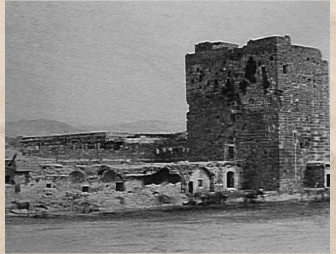
برج الكاشف كما ظهر في صورة ملتقطة في ستينيات القرن التاسع عشر

وبدأت التحسينات في الساحة تدريجياً بعد عام ١٨٤٠، وفي مرحلة لاحقة أقيمت المساكن والمقاهي وسوق للصاغة وبساتين، وزاد التقدم باتجاهها فيما كانت الأسوار المحيطة تزول أكثر وتزيد أهميتها، كما كانت تجمع الناس من بيروت ومن خارجها.